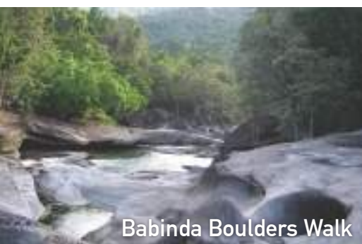
Babinda Boulders Walk

Wooroonooran Safaris besucht den grössten Regenwald der feuchten Tropen (Weltnaturschutzerbe) in Australien. Entspannen sie sich und geniessen sie den Tag waehrend ihr reiseleiter ihnen manche Geheimnisse vom tropischen Nord Queensland verraaet.